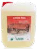
Anios RDA 5 L Kanister

Neutralisierender Klarspüler und Trocknungsaktivator